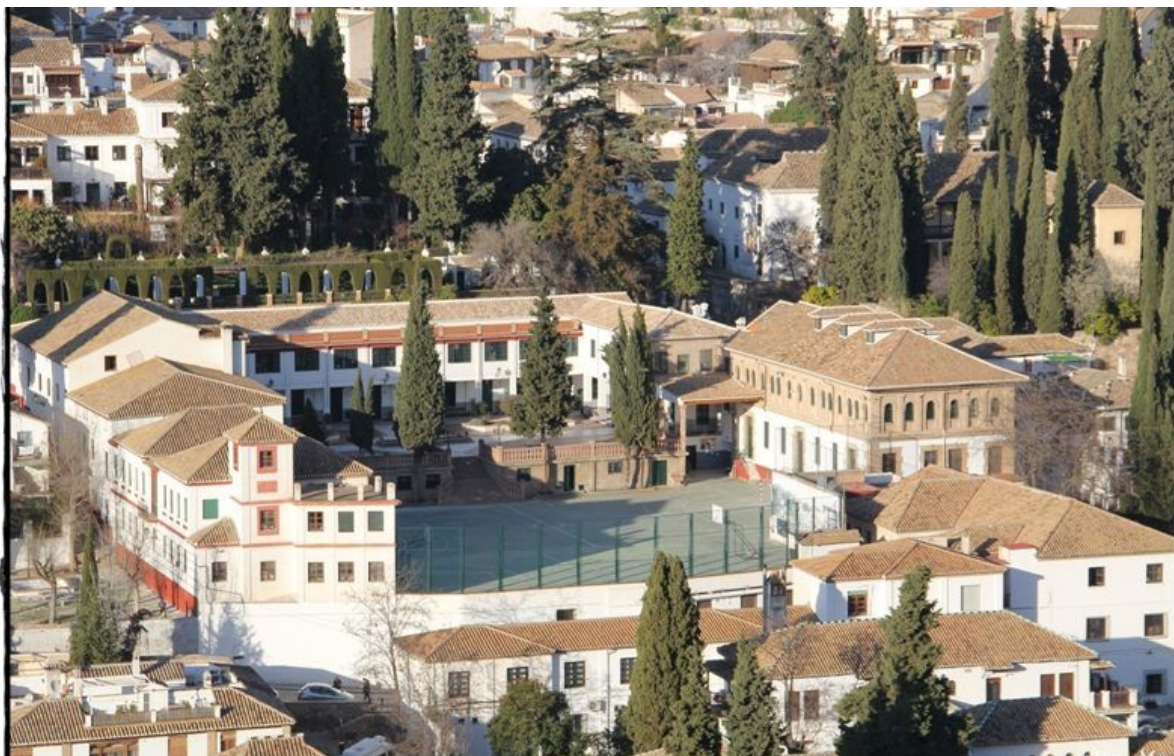
Panorama na Ave Maria Casa Madre.

Ave Maria Casa Madre - katolicka szkoła podstawowa zlokalizowana w Grenadzie (Cuesta del Chapiz, 3, 18010 Granada, Hiszpania). Szkoła znajduje się w dolinie Valparaíso, nad rzeką Darro, u podnóża Alhambry, w historycznych dzielnicach Albayzín i Sacromonte. Szkoła otoczona jest lasami, które zajmują ponad 1km.